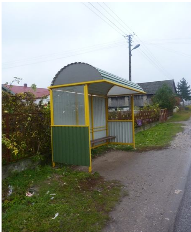
Zdjęcie nr 13: Zadaszony przystanek w Chomentowie.