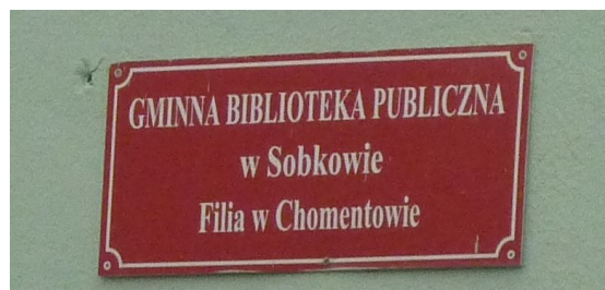
Zdjęcie nr 10: tablica informacyjna Gminna Biblioteka Publiczna w Sobkowie. Filia w Chomentowie

W budynku szkoły znajduje się również Gminna Biblioteka Publiczna w Sobkowie filia w Chomentowie, z której mogą korzystać mieszkańcy.