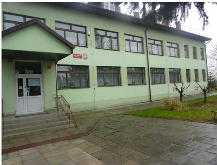
Zdjęcie nr 8: Szkoła w Chomentowie.