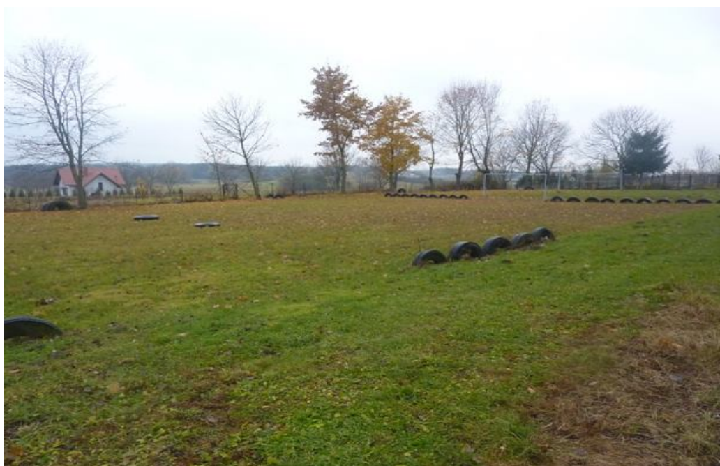
Zdjęcie nr 11: Boisko piłkarskie w Chomentowie.

W Chomentowie znajduje się boisko wiejskie do piłki nożnej, z którego korzystają mieszkańcy oraz „nieformalna” drużyna piłkarska, która uczestniczy w gminnych rozgrywkach w piłkę nożną. Posiada ono nawierzchnię trawiastą, wyznaczone oponami linie graniczne oraz bramki. Obok znajduje się również boisko do piłki siatkowej. Boiska wymagają dalszego zagospodarowania chociażby w ławeczki, kosze na śmieci.