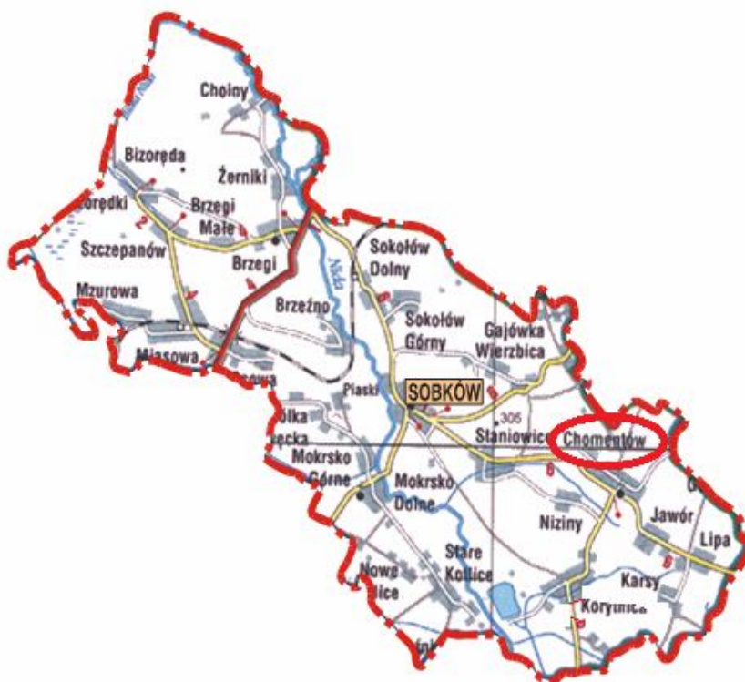
Rys. 2 Miejscowość Chomentów na tle Gminy Sobków.

Miejscowość Chomentów położona jest w północnej części Gminy Sobków i posiada współrzędne geograficzne 50°40'52"N i 20°31'56"E. Odległość od stolicy województwa-Kiele wynosi 26,6 km, od stolicy powiatu-Jędrzejowa-23,9km oraz od Urzędu Gminy Sobkowie-6,8km.