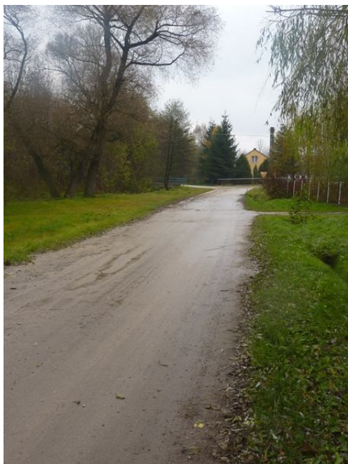
Na zdjęciu nr 12 droga w Chomentowie.

Transport zbiorowy zapewnia PKS Jędrzejów oraz prywatni przewoźnicy świadczący usługi busami. W miejscowości znajdują się dwa przystanki autobusowe zadaszone. Dzięki układowi linii busowych miejscowość ma połączenia komunikacyjne z większością okolicznych miast i wiosek. Przez miejscowość przejeżdża również autobus szkolny zabierając do szkół młodzież szkolną.