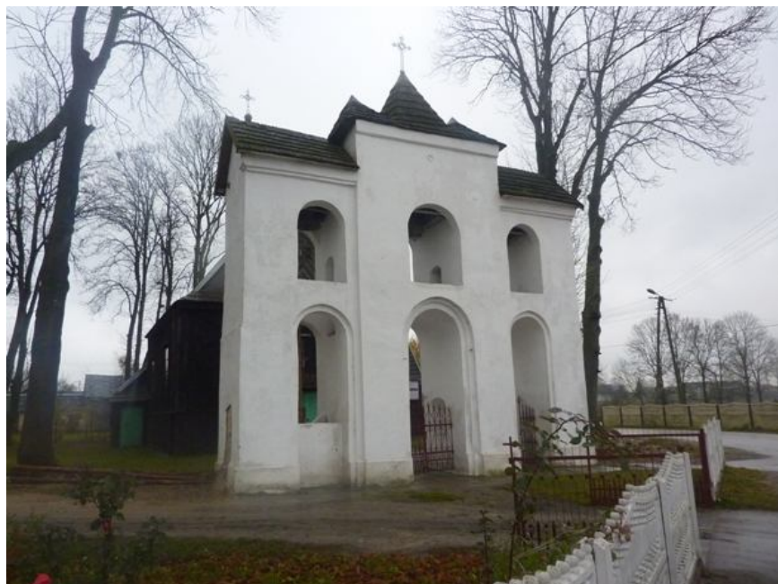
Zdjęcie nr 5: Dzwonnica przed Kościołem w Chomentowie.

u stóp Ukrzyżowanego Pana Jezusa; z drugiej strony przedstawiono scenę Zwiastowania i herb Rawa. Ogrodzenie murowane z bramką pochodzi z 1872 r.