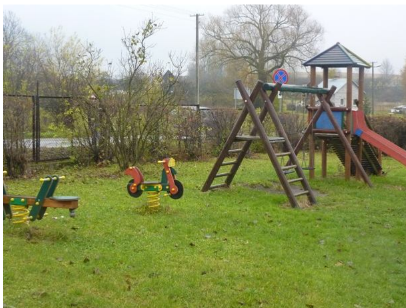
Zdjęcie nr 9: Mini plac zabaw przy szkole w Chomentowie.

Do dyspozycji najmłodszych dzieci jest mini plac zabaw, z którego mogą korzystać podczas zajęć w Oddziale przedszkolnym przy Szkole Podstawowej w Chomentowie. Istnieje również małe boisko szkolne, jednak nie jest ono do końca właściwie zagospodarowane.