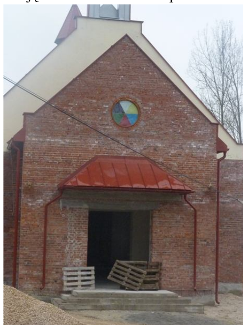
Zdjęcie nr 6: Obecnie budowany jest nowy Kościół.