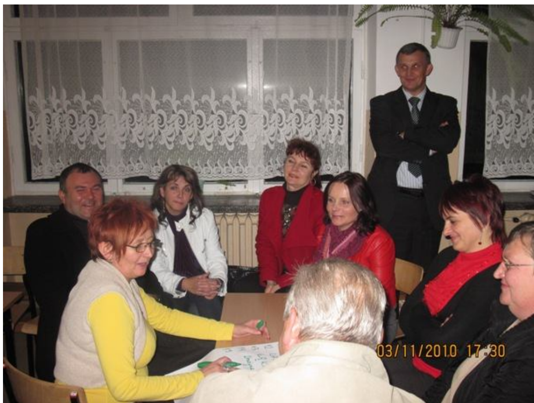
Zdjęcia nr 1 i 2 - zebranie robocze w sprawie Odnowy wsi w miejscowości Chomentów w dniu 3 listopada 2010r.