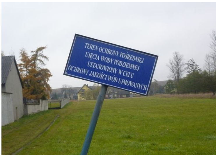
Zdjęcie nr 14: tablica informująca o ochronie wód gruntowych.

Miejscowość Chomentów znajduje się na terenie: Głównego Zbiornika Wód Podziemnych Nr 416 „Małogoszcz”. Również w granicach terenu znajduje się podlegające ochronie ujęcie wody „Chomentów”. Ujęcie wody składa się z dwóch wierconych: studni zasadniczej i studni awaryjnej. Na terenie oraz wokół ujęcia wody obowiązują ograniczenia w użytkowaniu