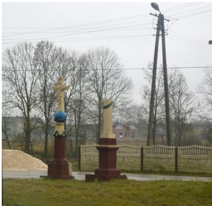
Zdjęcie nr 4: Dwa pomniki kamienne w Chometowie - pierwszy w formie globu ziemskiego z krzyżem, opasanym węzem (na zdjęciu po lewej), drugi w formie ściętej kolumny (po prawej).