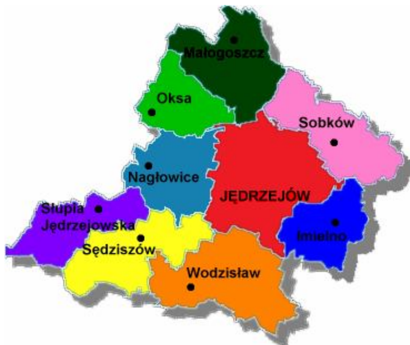
Rys. 1 Gmina Sobków na tle powiatu jędrzejowskiego.

Gmina Sobków położona jest w granicach administracyjnych województwa świętokrzyskiego, w jego centralnej części. Zajmuje północną część powiatu jędrzejowskiego, sąsiadując bezpośrednio z gminami: Małogoszcz od północnego-zachodu, Jędrzejów od zachodu, Imielno od południa, Kije od południowego-wschodu (powiat pińczowski), Morawica od wschodu (powiat kielecki), Chęciny od północnego-wschodu (powiat kielecki).