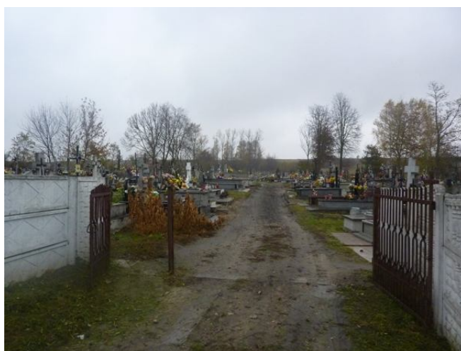
Zdjęcie nr 7: W pobliżu znajduje się również cmentarz parafialny.