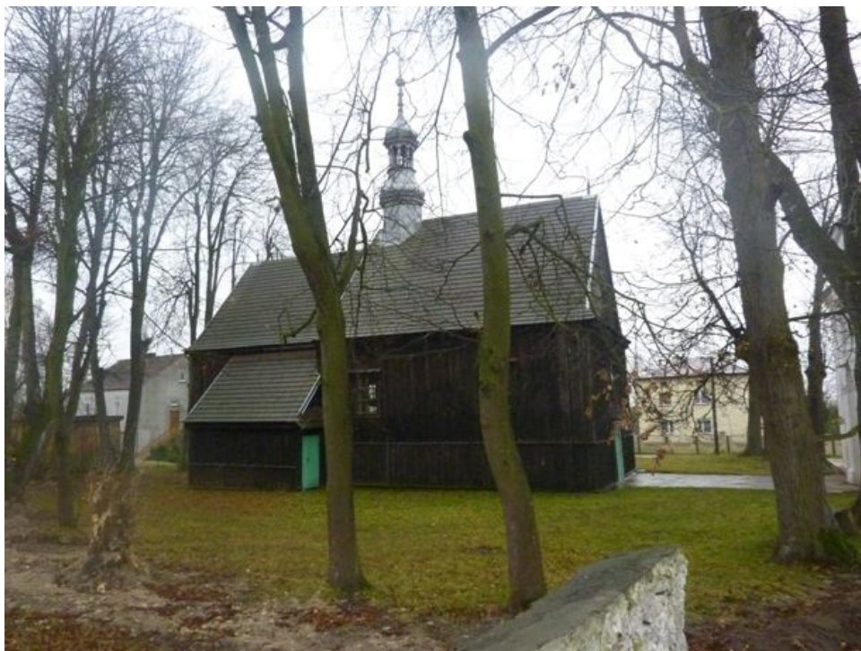
Zdjęcie nr 3: Kościół w Chomentowie

Zbyt małe środki jakie posiadał do dyspozycji miejscowy proboszcz sprawiły, że w opisie Dyrekcji Ubezpieczeń stan budynku określono jako mierny. W 1863r. w dokumentach parafii chomentowskiej zapisano: „na kościele dach skutkiem starości zepsuty, przez co sufit drewniany gnije, w czasie dreszczów do kościoła i kruchty leje się”.