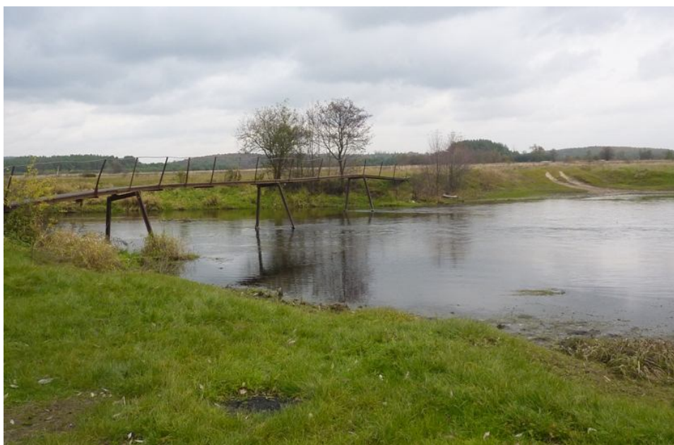
Zdjęcie nr 4. Teren nad rzeką Nidą w miejscowości Żerniki