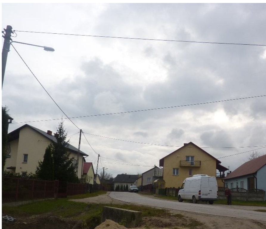
Zdjęcie nr 3. Układ zabudowy w miejscowości Żerniki

Miejscowość jest typem wsi „ulicówka” charakteryzująca się w niektórych miejscach luźną zabudową. Dominuje budownictwo typu małomiasteczkowego z charakterystyczną dla niego strukturą obiektów zlokalizowanych wzdłuż głównej ulicy. Przeważają budynki parterowe oraz dwu-kondygnacyjne w układzie wolnostojącym. Zakłada się utrzymanie wykształconych układów przestrzennych. Niezbędne są jednak zmiany wynikające z potrzeb zgłoszonych podczas zebrania strategicznego dotyczących obszaru dla rozwoju funkcji rekreacyjnych i wypoczynkowych oraz uporządkowanie i podniesienie jakości przestrzeni publicznej związanej z obiektami użyteczności publicznej.