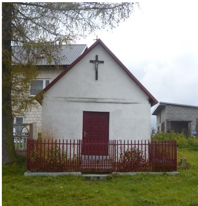
Zdjęcie nr 6. Kaplica w Żernikach.