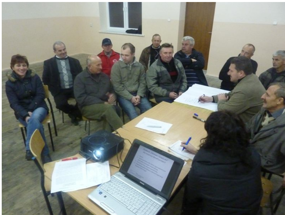
Zdjęcie nr 1 . Debata strategiczna 03.11.2010 r.