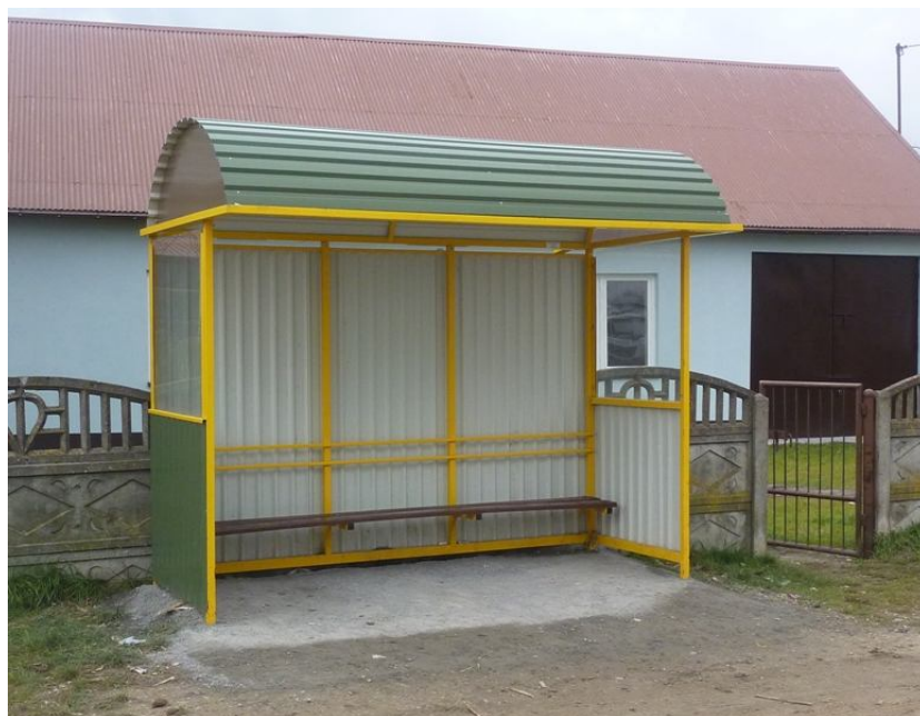
Zdjęcie nr 10. Przystanek autobusowy