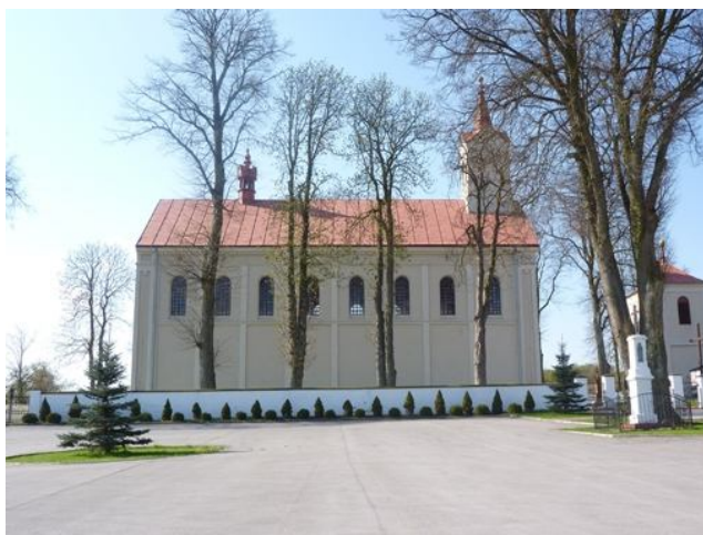
Zdjęcie 7: Kościół św. Mikołaja w Brzegach do którego parafii należą mieszkańcy miejscowości Żerniki.

nimi obraz Matki Boskiej z Dzieciątkiem z początku XVII wieku. W górze ołtarza podziwiać można rzeźbę Trójcy Świętej. Po obu jego stronach stoją postacie św. Piotra i Pawła, a nieco dalej św. Mikołaja i Jana Chrzciciela. Nie ma już dwóch bocznych ołtarzy z XIX wieku, które opisywał ksiądz Wiśniewski. Spłonęły w pożarze w latach 50. ubiegłego wieku.