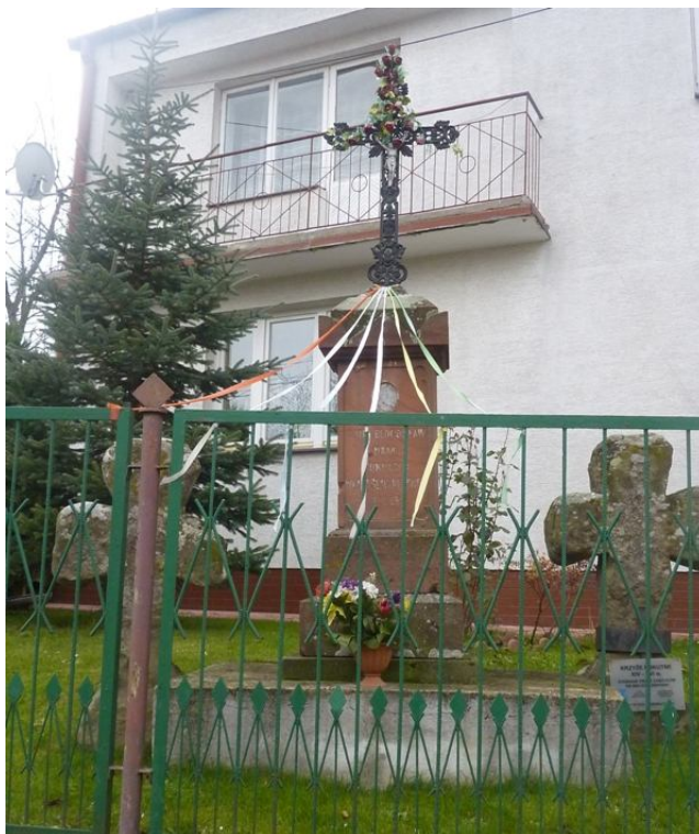
Zdjęcie nr 5. Krzyże pokutne