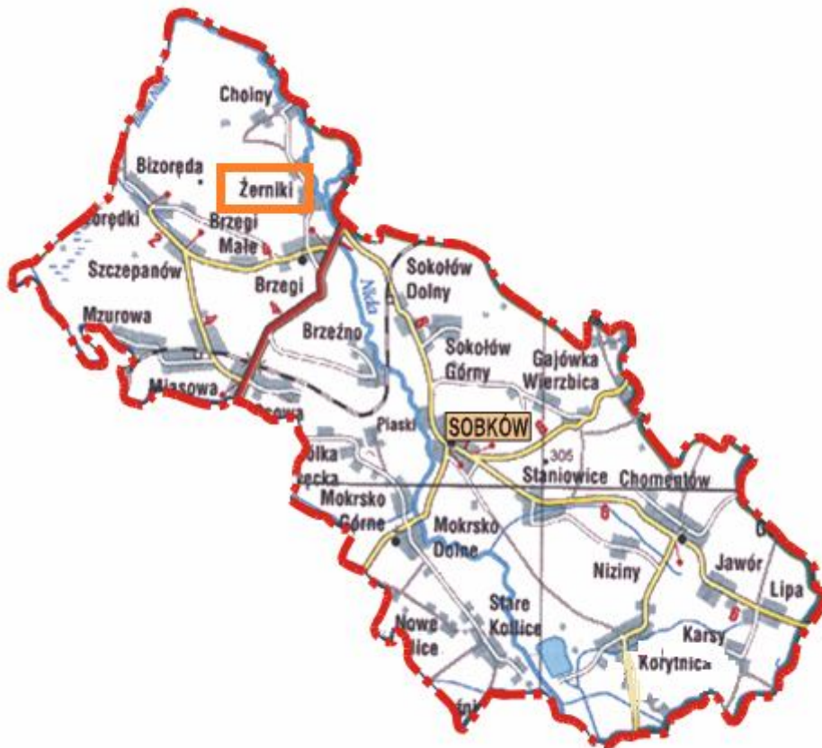
Miejscowość Żerniki na tle gminy Sobków

Wieś Żerniki położona w terenie pagórkowatym nad Białą i Czarną Nidą. Nazwa wsi pochodzi od słowa „żyrydniki”, określające ludność służebną księcia.