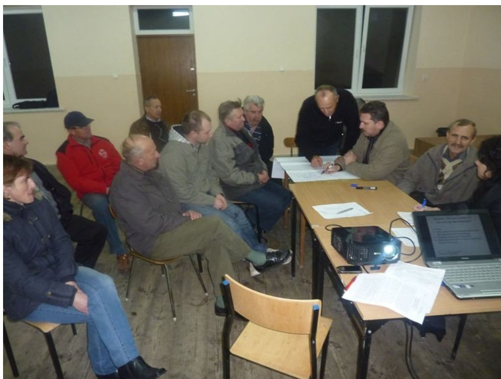
Zdjęcie nr 2. Debata strategiczna 03.11.2010 r.