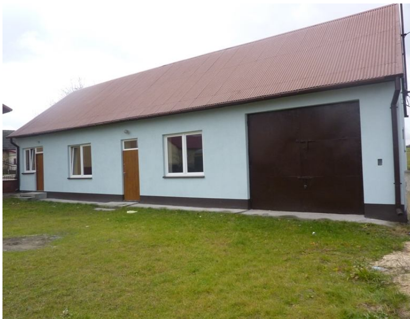
Zdjęcie nr 8. Remiza OSP (adaptacja na świetlicę wiejską)