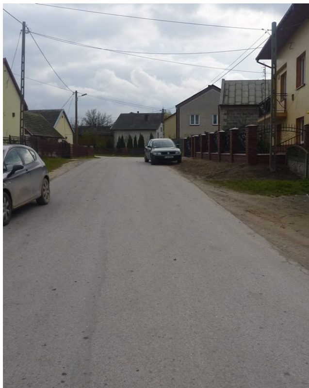
Zdjęcie nr 9. Droga w miejscowości Żerniki.