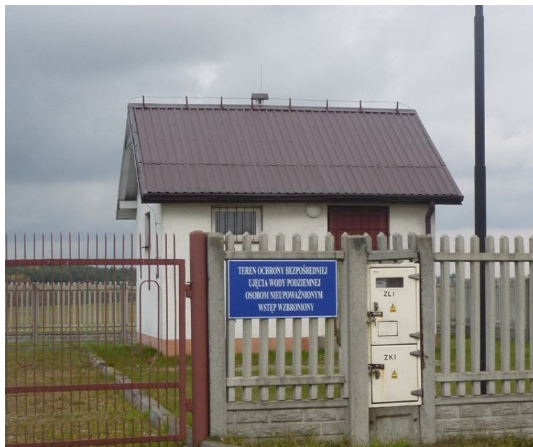
Zdjęcie nr 11. Ujęcie wody podziemnej w miejscowości Żerniki

W granicach miejscowości Żerniki znajduje się ujęcie wody podziemnej.